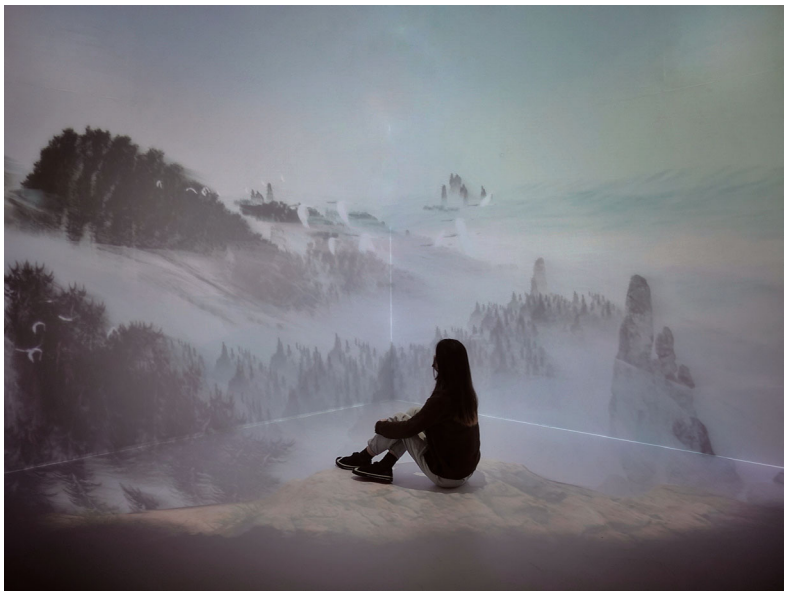
「想識·賞析中國山水畫」展覽現場。

在飛速發展，藝術館如何保持、發揮自身特性，在香港日漸壯大的機構版圖中找到自我定位？值得注意的是，藝術館迄今為止依舊是香港唯一一間公立的館藏美術館（大館當代藝術館是私立民營無館藏機構，M+博物館和香港故宮均是公辦民營有館藏機構），隸屬香港特區政府康樂及文化事務署，每年的預算均由香港政府撥款。這是香港藝術館可以做到對全民免收基礎門票的原因，財政主要壓力已由香港政府消化。對比M+博物館（正價門票港幣120元，特別展覽正價門票港幣240元）和香港故宮（成人門票港幣50元，特別展覽成人門票港幣120元），藝術館最沒有觀賞門檻。但與此同時，香港藝術館需要格外思考如何反覆吸引觀眾入場，在以普及姿態示人的同時又保有魅