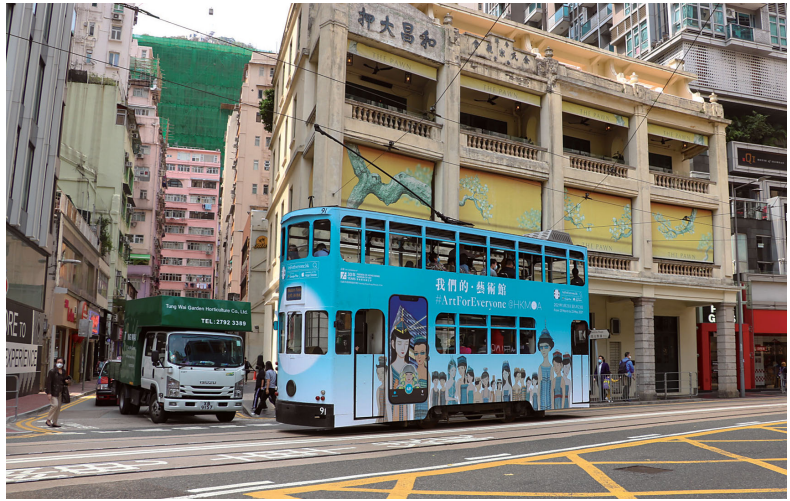
「我們的·藝術館」宣傳電車行駛在香港灣仔街頭。